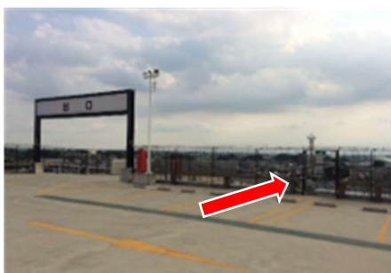
非常階段の出入口（屋上）