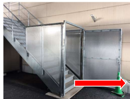
非常階段の出入口（1階）